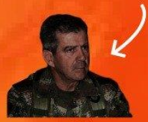
Mario MONTOYA URIBE

Presuntamente vinculado con cerca de 2429 falsos positivos. Se sometió a la JEP pero no reconoció a todas las víctimas.