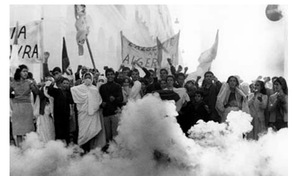
Imagen de la película "La batalla de Argel"

Planteos nuevos que mete las zonas liberadas y lo territorial, ligado a la idea de Doble Poder, como antecedentes determinantes de la concepción de Poder Popular pero que no implican exactamente lo mismo como veremos mas adelante. Porque lo que empieza a plantear la Revolución China y Vietnamita es que esos ejércitos pueden conseguir liberar zonas del poder estatal, del poder dominante, y construir en esas zonas liberadas su propio poder, sus propias instituciones, sus propias formas de organización social. Meten un concepto nuevo, una idea nueva: la idea de asociar la construcción de Doble Poder a la idea de lo territorial. La dirección sigue siendo el partido-vanguardia. El partido marxista leninista que ya vamos a analizar. Pero hay un dato nuevo que es la idea de cerco. En ambas revoluciones se parte del campo, del sujeto campesino, por