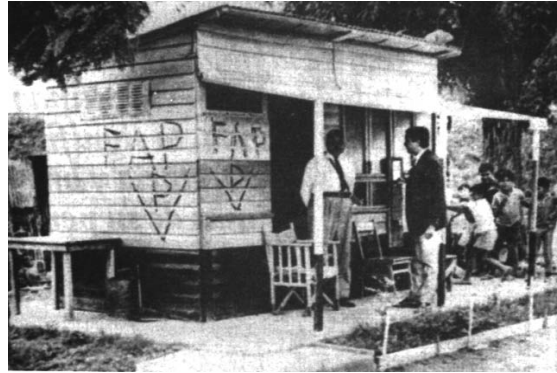
Toma de "Villa Piolín" por las FAP, 1970