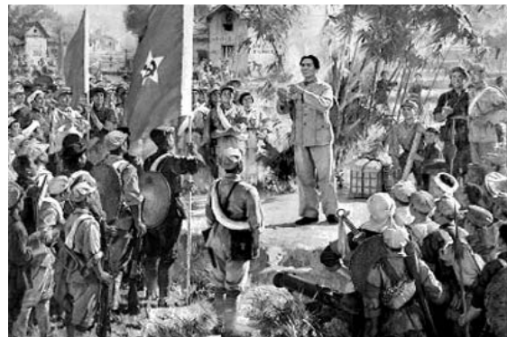
Revolución Cultural China

que es un hecho íntimo, lo saca al Estado colonial y empieza a ser el FLN el que legitima eso. En una película famosa, la batalla de Argelia de un cineasta italiano, Gillo Pontecorvo, se va a ver cómo el FLN durante años realiza un trabajo en las zonas más marginadas de Argelia, las Casbah, lo que sería las villas miseria de acá, los cantegriles de Uruguay o las favelas en Brasil. Realiza un trabajo en los sectores más marginados y dice, antes de atacar a los franceses: Todo aquel que prostituya a una argelina va a ser ejecutado por el FLN. Todo aquel que venda droga debilitando a un argelino frente a la dominación extranjera, va a ser ejecutado por el FLN. Todo aquel que se alcoholice, que difunda alcohol, etc. para hacer más débil a nuestra sociedad, frente al invasor, va a ser ejecutado por el FLN. Generan sus propias leyes, generan sus propias lógicas de identidad, y a partir de allí se lanzan al asalto,