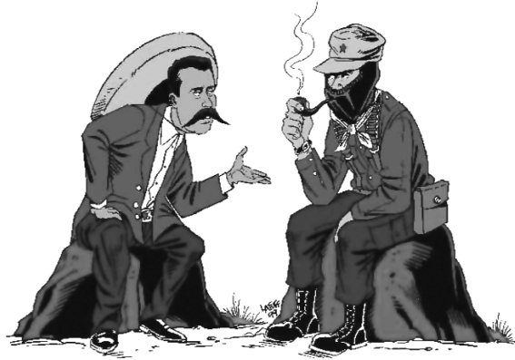
Emiliano Zapata y el subcomandante Marcos (EZLN)

Así como hay experiencias en que la revolución termina en cárcel- el caso más conocido es el estalinismo y la Unión Soviética- hay ejemplos también donde los sectores populares no aceptaron tomar el poder. Analicemos esos ejemplos, Sandino en Nicaragua, en la década del '30, había construido una enorme legitimidad, fue a negociar con Somoza, entabló una negociación y lo mataron a la salida de la entrevista. Y todo lo que había construido fue arrasado en el proceso de un año. Villa y Zapata en la revolución mexicana, una de las revoluciones más extraordinarias de Latinoamérica y menos conocidas, ya que hablamos