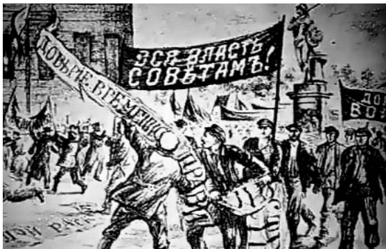
Revolución Rusa, "todo el poder a los soviets"

Arrancando de eso, el primero que teoriza algo que podríamos considerar un antecedente de la concepción de Poder Popular es Trotsky. Trotsky en el año 1929 escribe su trabajo sobre la Revolución Rusa. La Revolución Rusa de 1917, él hace una historia de esa revolución, y ahí Trotsky tira el tema del Doble Poder. Dice: lo que sucede en todas las revoluciones, no sólo en la Rusa, es que las clases dominadas, encabezadas por la clase obrera, dice Trotsky, generan instituciones autónomas. Las clases subalternas, en un proceso revolucionario van generando sus propias instituciones. Las características que tienen estas instituciones populares, para llamarlas de alguna manera, es que no dependen del Estado, no dependen de la clase dominante. De hecho, lo que va surgiendo, dice